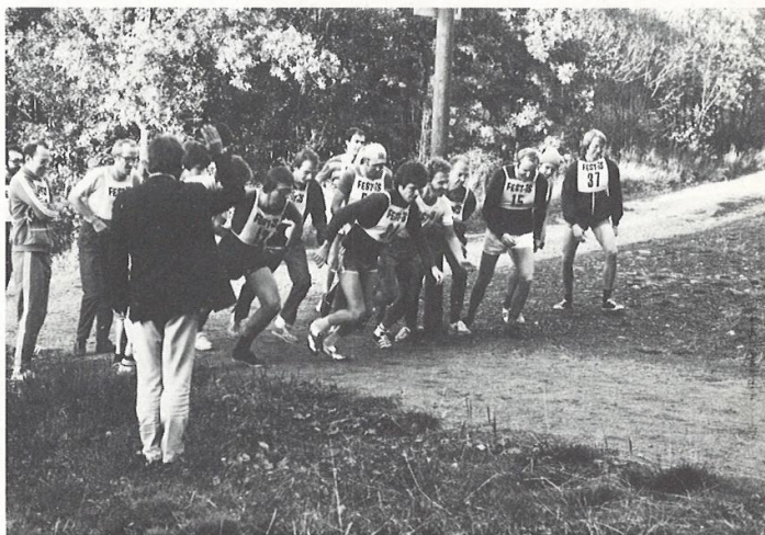
Starten går i höstens T/Fo-open.

Tisdagen den 21 september avhölls det numera till tradition vordna terrängloppet T/Fo-open. Arrangörerna kunde till sin glädje notera nytt rekord i antalet deltagare. Femton män och — nota bene! — tre kvinnor ställde upp för att i ädel tävlan lubba runt den tre kilometer långa motionsslingan vid Sättra mot ett hägrande målsnöre och en åtråvärd pokal.