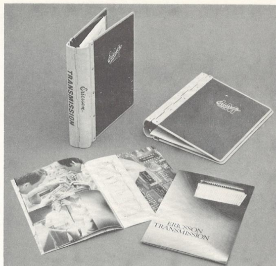
T:s nya kundpärm samt T-broschyren.

Innehållet i pärmen bestäms inom vederbörande säljsektion med hänsyn till varje speciell marknad. Det finns en innehållsförteckning framtagen, men det står säljaren fritt att använda den eller att komponera en egen. Som standard har pärmen ledblad 1-10 med orangefärgade flikar.