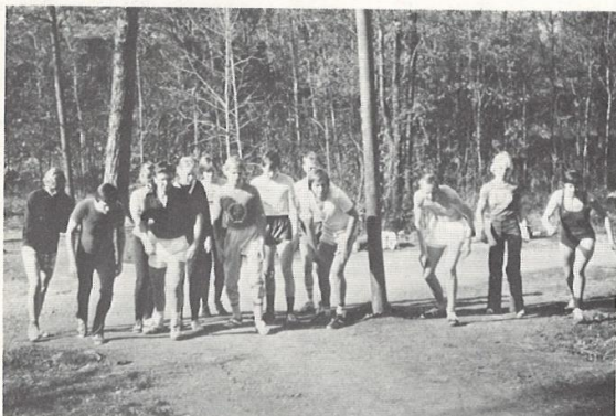
Starten går i terränglöpningen, en av grenarna i 6-kampen.