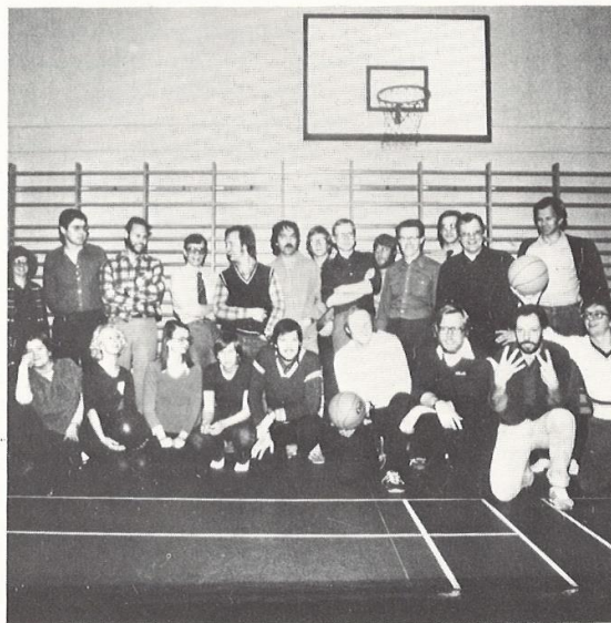
En del av PO-OPEN-gänget samlad under basket-nätet.