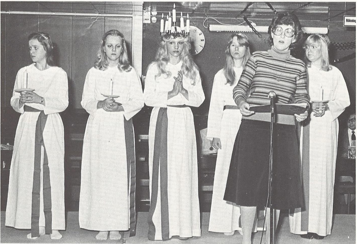
Gläns över sjö och strand stjärna ur fjärran...