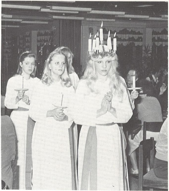
Då i vårt mörka hus stiger med tända ljus Sankta Lucia...