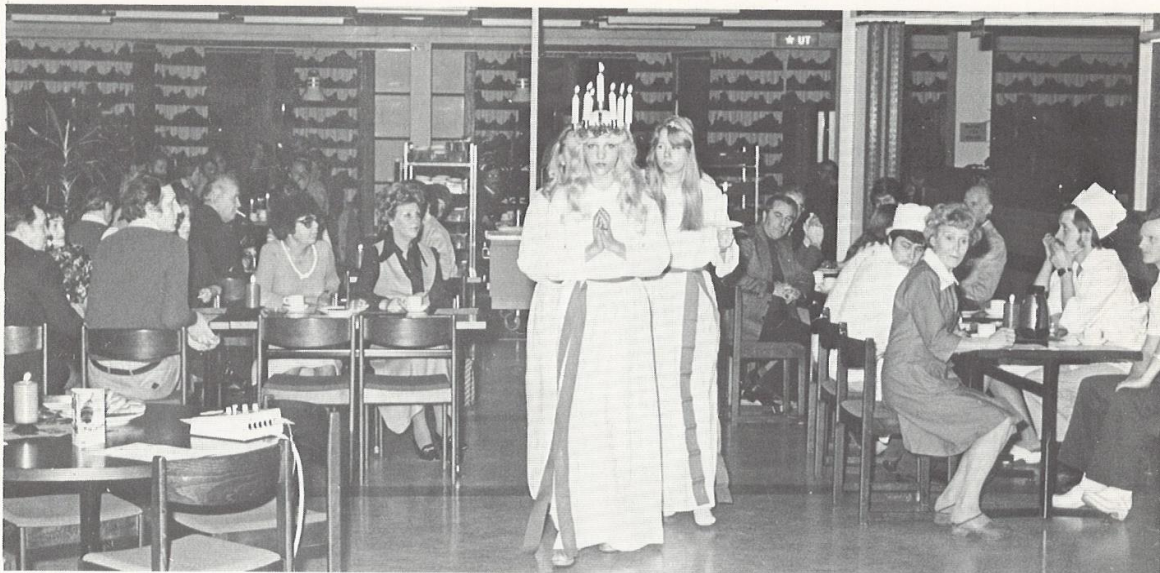
Sankta Lucia, ljusklara hägring...